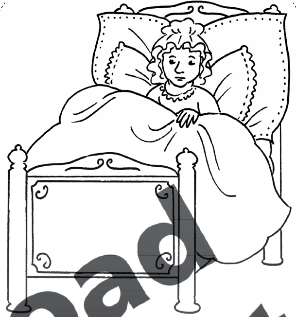
Maria Magdalena van Beethoven