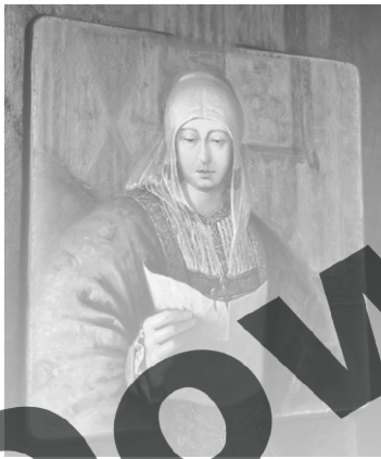
Isabel I de Castilla