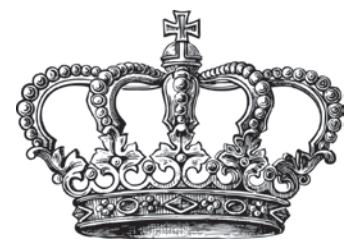
König Heinrich IV.