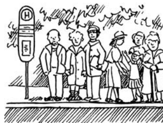
Streik der Busfahrer