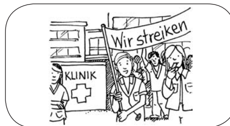
Streik der Krankenschwestern