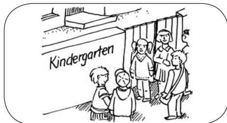
Streik der Erzieherinnen