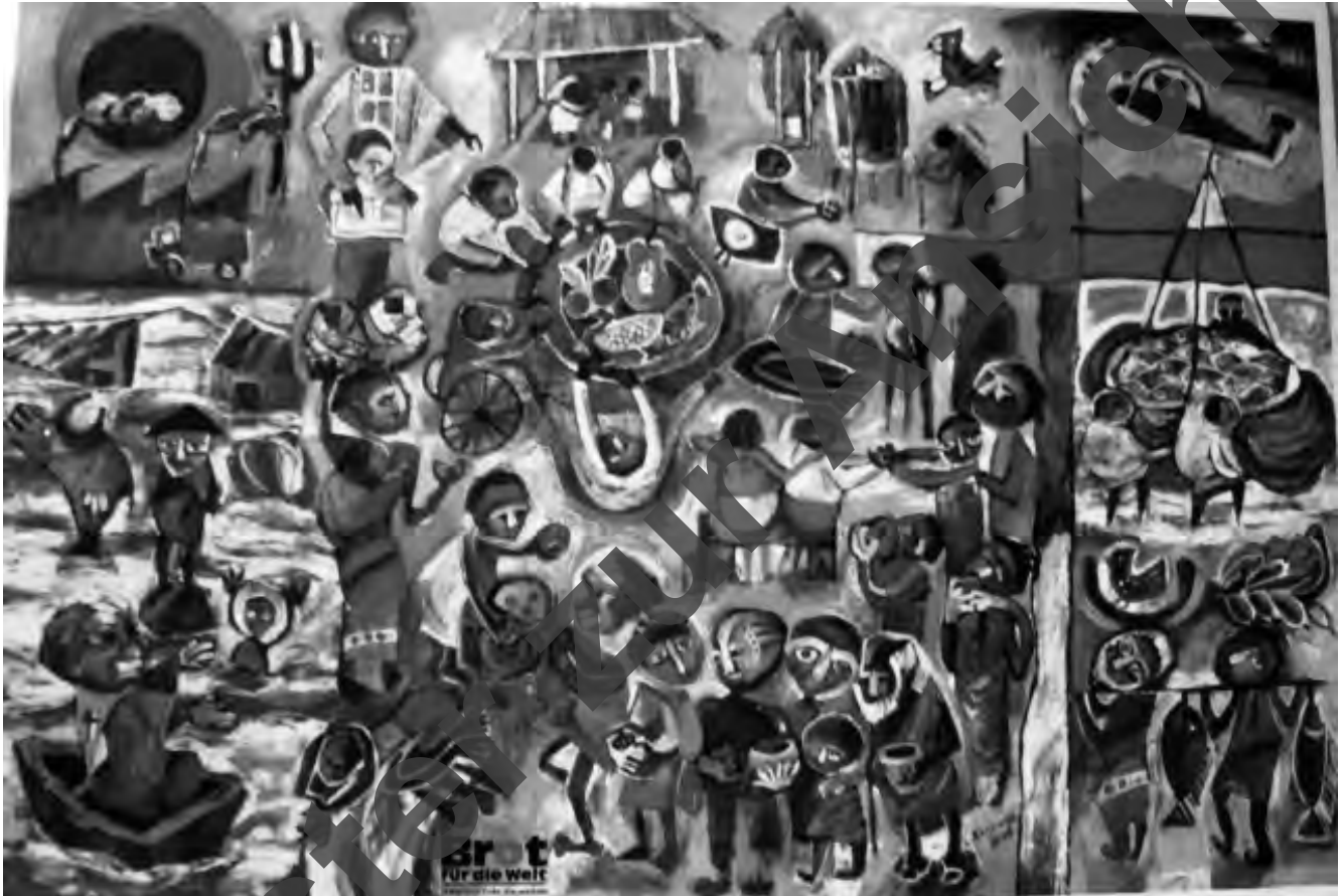
Hungertuch 2010 Bad Krozingen.

Der Brauch, während der Passionszeit ein Hungertuch in der Kirche aufzuhängen, ist seit dem frühen Mittelalter nachweisbar. Im hohen Mittelalter wurde das Hungertuch meist mit Abbildungen des Leidens Jesu oder auch mit Motiven aus dem Leben Jesu verziert. In neuerer Zeit wurde dieser Brauch wieder aufgenommen. Die Hungertücher sollen an die Not der Menschen in der dritten Welt erinnern. Sowohl MISEREOR auf katholischer Seite als auch BROT FÜR DIE WELT der evangelischen Kirche gestalten Hungertücher in diesem Sinne.