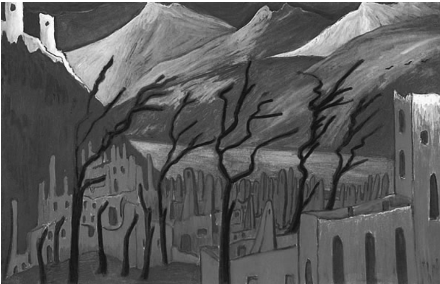
Marianne von Werefkin: Rote Stadt (1909)

Der Expressionismus (ca. 1905–1925) steht für den eigentlichen Beginn der Moderne in Deutschland. Es galt, alles Konventionelle hinter sich zu lassen und neue Formen der Darstellung zu finden. Die neue Generation der hauptsächlich in bürgerlichen Verhältnissen aufgewachsenen Schriftsteller und Dichter wurde dabei maßgeblich von der bildenden Kunst beeinflusst.