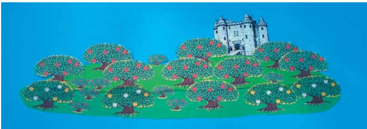
Abbildung 12: Die Apfelinsel

Die ausgedachten Geschichten werden je nach Altersstufe dokumentiert (Bilderfolgen, Texte, Erzählmittel etc.), sodass sie von ihren Autorinnen und Autoren weiter erzählt werden können.