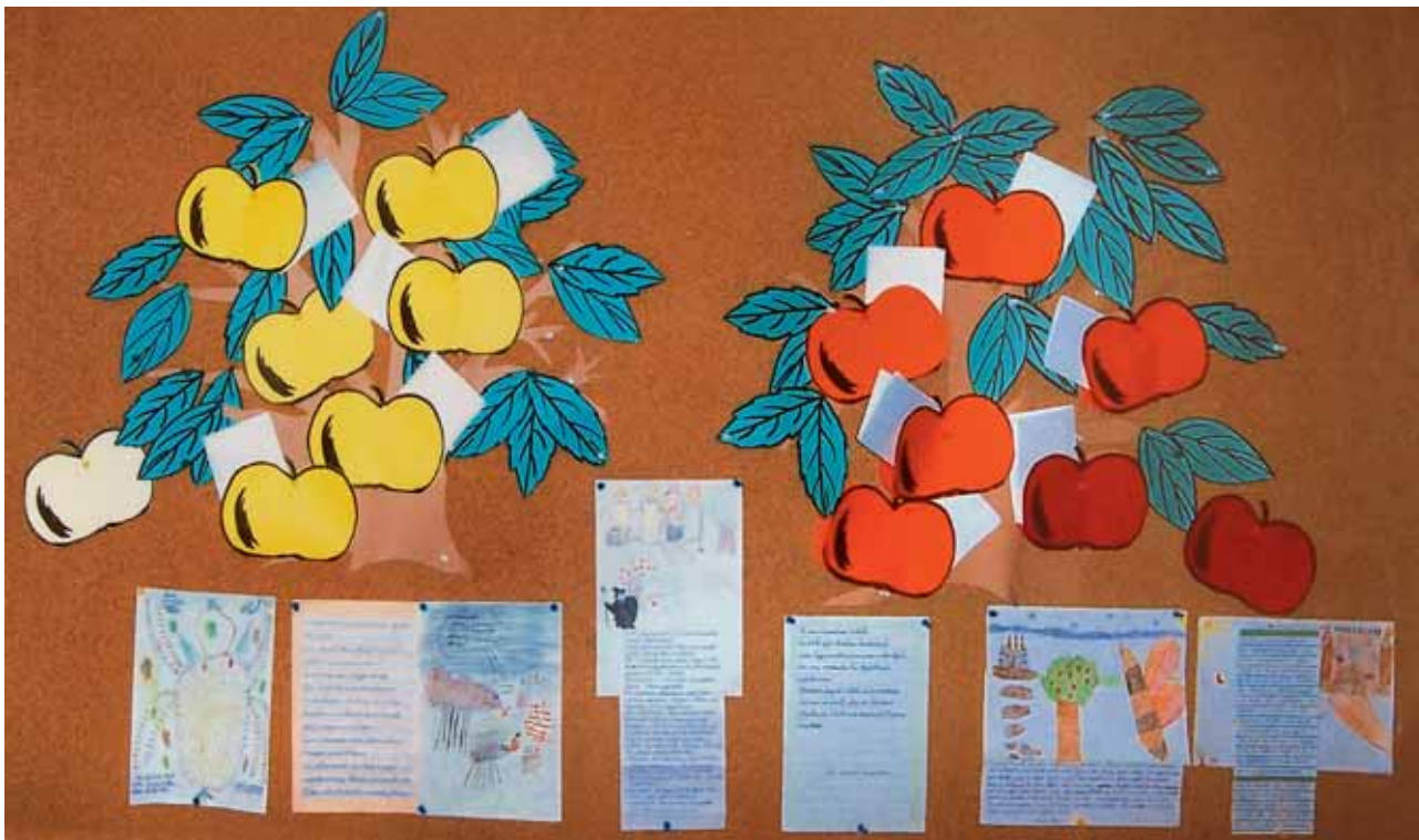
Abbildung 14: Apfelbäume

stellen eines großen „Erzählbaumes“ als sichtbare und vorweisbare gemeinsame Produktion vorgeschlagen. Zum Schluss des Projektes könnte ein Erzählfest, ein Elternnachmittag etc. stattfinden, anlässlich dessen die Kinder ihre „neuen“, selbst erfundenen Geschichten anderen erzählen. Wichtiges Ergebnis außerdem: die gemeinsame Erfahrung, dass aus einem gemeinsamen „Anfang“ so viele verschiedene Geschichten entstehen können.